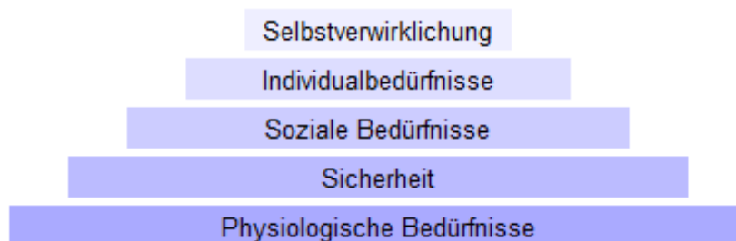
Abbildung 1: Maslowsche Bedürfnispyramide

Die Stufen darüber stellen Sicherheits- und soziale Bedürfnisse dar, welche ebenfalls durch einen engen Zusammenhang mit dem Thema Wohnen gekennzeichnet sind. Dies zeigt sich beispielsweise bei „Wohnkriterien“ wie „Einbruchschutz“ oder „Qualität der sozialen Infrastruktur“. Die Individual- oder Anerkennungsbedürfnisse, die auf Wohlstand, Status und Erfolg ausgerichtet sind, weisen im Allgemeinen ebenfalls einen starken Zusammenhang mit dem Thema Wohnen auf. Die Ebene der Selbstverwirklichungsbedürfnisse zielt auf Motive wie Perfektion und Selbstverbesserung ab.