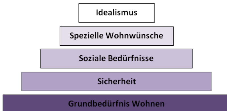
Abbildung 2: Bedürfnispyramide Wohnen

Doch auch das allgemeine Modell von Maslow lässt sich auf das Thema Wohnen übertragen. Die Autorin hat dafür das in Abbildung 2 dargestellte Schema einer Bedürfnispyramide Wohnen entwickelt.